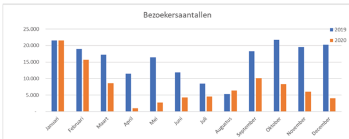
Tabel 1 overzicht bezoekersaantallen

2020 rondom COVID-19 zijn de bezoekersaantallen in deze periode, net als tijdens de eerste lockdown, meer dan gehalveerd t.o.v. 2019.