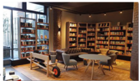
bibliotheek functie laagdrempelig ontmoeten Huiskamer van Dalfsen