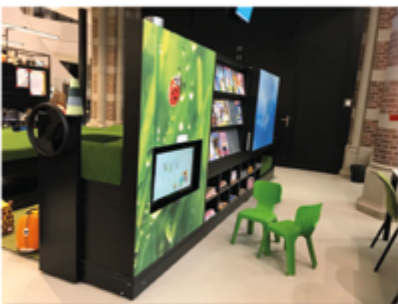
thema hoeken verblijven en uitnodigend voor verschillende doelgroepen